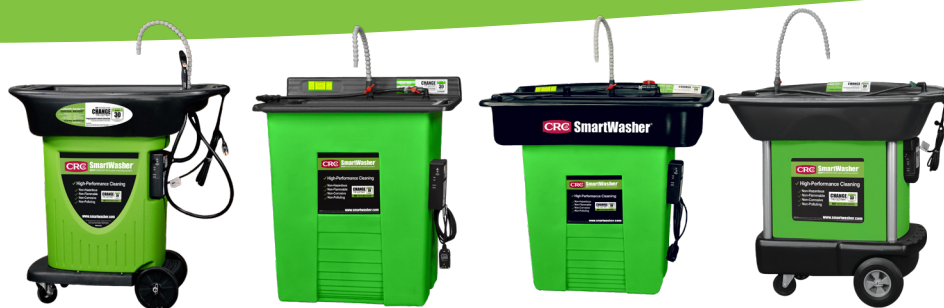
SW-23 Fahrbarer Teilereiniger